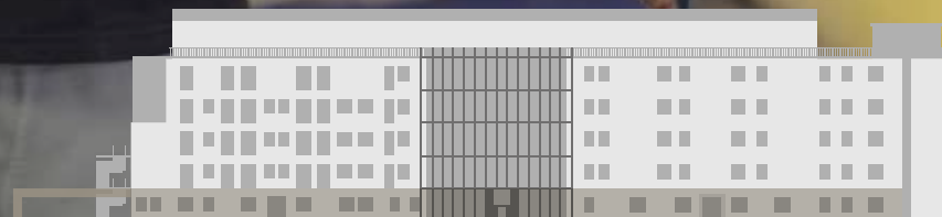
PIANO TERRA | Poliambulatorio

Il servizio di Terapia Antalgica si effettua al piano terra.